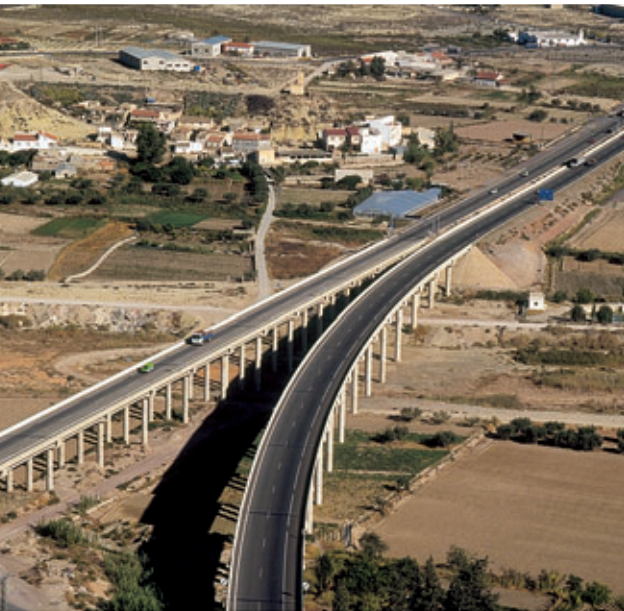
Autovía de Lorca, que conecta con Andalucía.